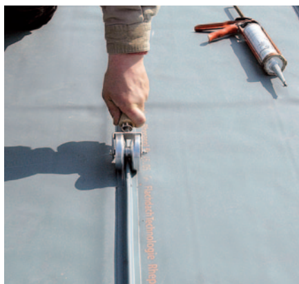
После склеивания пластмассовые профили обрабатываются прикаточным роликом.

Отдельные кровельные мембраны специалисты прикрепили друг к другу с помощью интегрированной системы липучки. Для