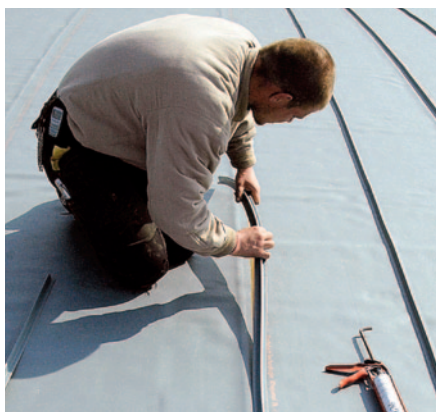
Гибкие профили со стоячим фальцем на нижней стороне оснащены самоклеющимся краем.

листов-плотников также входила прокладка воздухопроницаемого пароизоляционного слоя. Основанием, на котором затем выполнялись все кровельные работы, служила несущая конструкция из многофункциональных панелей, к которым прибавались битумные подкладочные полотна.