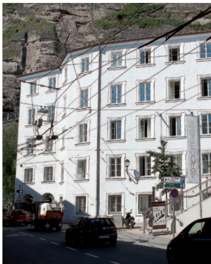
В правительственном здании в старой части города Зальцбурга недавно был проведен капитальный ремонт.